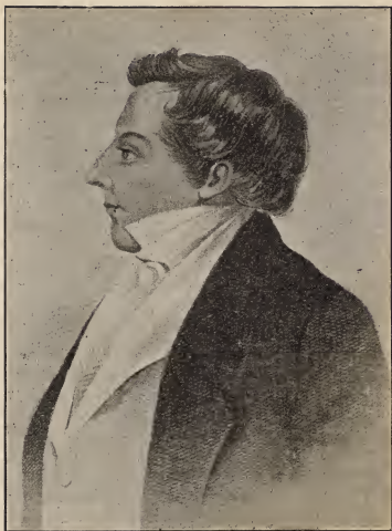
JOSEPH SMITH Jr., 1805 — 23 DECEMBER — 1905.

„Welk Amerikaan uit de geschiedenis der 19de eeuw heeft den machtigsten invloed op zijne landgenooten uitgeoefend? Het is in geen geval onmogelijk dat het antwoord op deze vraag zal zijn: JOSEPH SMITH, DE MORMOONSHE PROFEET. . . . De man die in deze eeuw van vrij debat een godsdienst heeft opgericht, en door honderduizenden als een rechtstreeksch gezant van den Allerhoogste wordt gehuldigd, — zulk een zeldzaam wezen kan niet eenvoudig ter zijde gezet worden door zijne nagedachtenis stootende scheldnamen toe te werpen. . . . De allerwichtigste vragen die de Amerikanen elkander heden afvragen, hebben met dezen man te doen, en met hetgeen hij ons heeft nagelaten.”