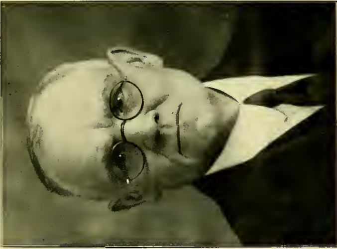
DR. JAMES E. TALMAGE AFTREDEND PRESIDENT VAN DE EUROPEESCHE ZENDING