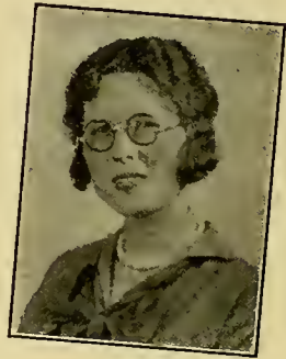
Bijenkorfmeisjes Openbaar spreken