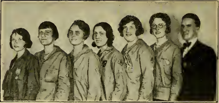
Bijenkorfmeisjes Dubbel Zangtrio.