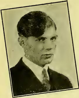
M.-Mannen Openbaar spreken.