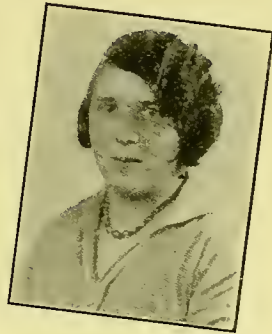
Bijenkorfmeisjes Weergegeven Verhaal.