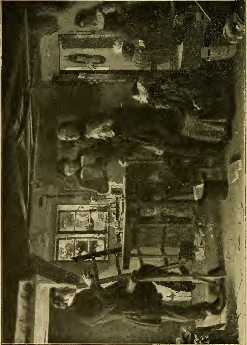
Foto van een schilderstuk van Christian Dalsgaard in het stadsmuseum te Kopenhagen (ettelijke jaren geleden geschilderd). Zie bl. 293.