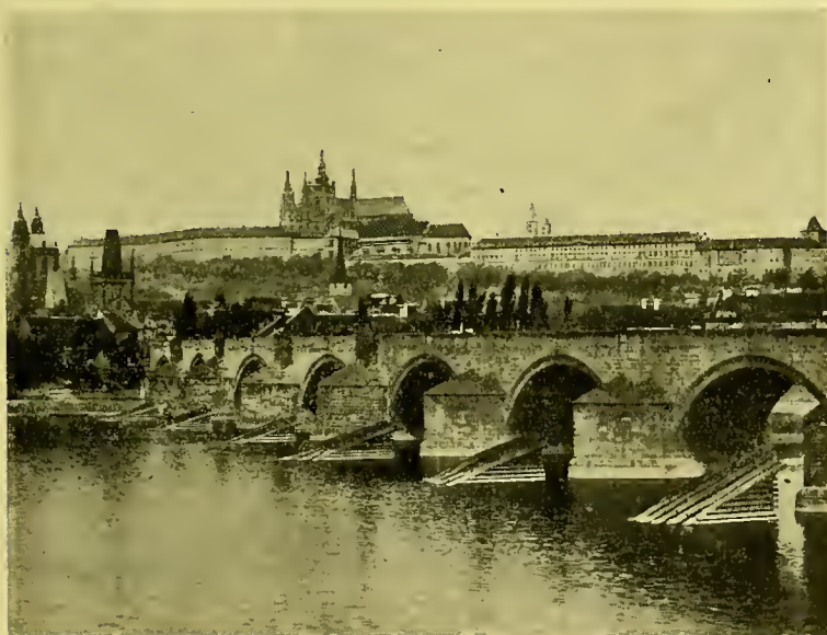
Een brug in Praag. In de verte de St. Vitusdom.

Waar de Europeesche Zendingpresidenten vergaderden.