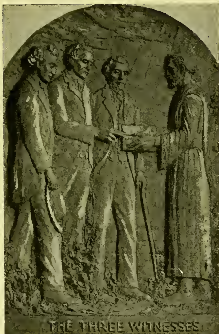
De drie getuigen ontvangen hun getuigenis.

Wij zijn dankbaar voor de honderden en duizenden manifestaties, welke aan personen zijn gegeven, ja, zelfs millioenen manifestaties aangaande de goddelijkheid van het Boek van Mormon.