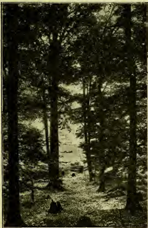
Het Heilige Bosch