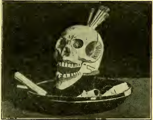
Dit Aschbakje Draagt zijn Eigen Waarschuwing

Met een tabak- en alcoholslaaf is het ongeveer hetzelfde. Het gif mag niet zoo sterk zijn als het opium, maar het bestaat toch. Vergeet niet, dat een cigaret een marmot kan doden. Wanneer een persoon waarlijk wil wonen in een lichaam, door-