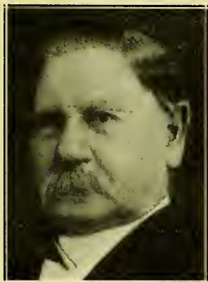
Charles W. Penrose

Er zijn zoovele verschillende godsdienstige richtingen in de wereld, waarvan een elk niet alleen beweert, juist te zijn, doch eveneens goddelijk, dat een redelijk verstand, door secte noch geloof bevooroordeeld, door zijn pogingen, godsdienstige waarheid te bereiken en te aanvaarden, geheel in de war geraakt en er een afgrijzen voor krijgt. De zoo vaak geuite bewering, dat alle christelijke secten juist zijn, is een in het oog loopende ongerijmdheid. Waarheid is immer met zichzelf in overeenstemming. Het is dwaling, welke verwarring veroorzaakt. Twee tegenstrijdige systemen kunnen niet beide juist zijn. Zij kunnen beide