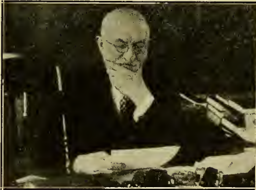
President Heber J. Grant

Ik gevoel me zeer dankbaar jegens diegenen onzer vrienden, die ons vanavond met hun aanwezigheid hebben vereerd en geen leden onzer Kerk zijn. Het is mijn buitengewoon groot verlangen, dat deze menschen, die hier vanavond zijn gekomen, de boodschap, welke wij te geven hebben, mogen ontvangen. Die boodschap is, dat God weder van de hemelen heeft gesproken, dat Hij weder de Kerk van Zijn Zoon Jezus Christus hier op aarde heeft gevestigd en dat in der waarheid het plan van leven en zaligheid, hetwelk tot het eeuwige leven in