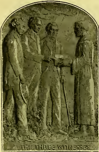
Plaquette op het Cumorah Monument

wijze, dat Joseph Smith een profeet van God was, doch dat hij door den invloed, welken Sidney Rigdon op hem uitoefende, een gevallen profeet was geworden; dat hij alles aanvaardde, wat tot aan het jaar 1835