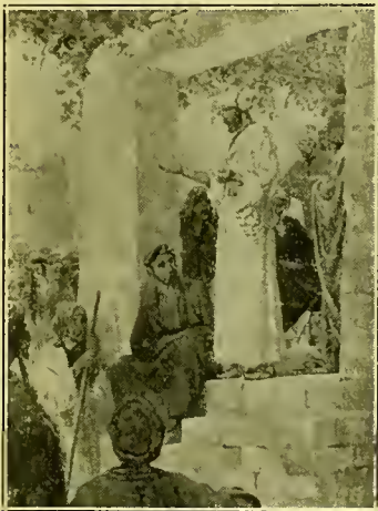
Petrus' toespraak op het Pinksterfeest

Een van de krachtigste bewijzen van het bezitten van den Heiligen Geest in de vroegere christelijke Kerk was de eenheid, welke hij vestigde. Ongeacht, wat de tegenstrijdige gelooven en de door de menschen ingestelde bestrijdende geloofsbelijdenissen van dien tijd waren vóór het ontvangen van den geest van het eeuwig Evangelie na den doop en het opleggen der handen voor de gave des Heiligen Geestes, zij werden allen één in Christus Jezus. Zooals Paulus aan de Efezen schreef: „Eén lichaam is het, en één Geest, gelijkterwijs gij ook geroepen zijt tot eene hoop uwer beroeping. Eén Heere, één geloof, één doop. Eén God en Vader van allen, die daar is boven allen en door allen en in u allen." (Ef. 4:4-6). Want zoo velen, als gij in Christus gedoopt zijt, hebt gij Christus aangedaan. Daarin is noch Jood noch Griek; daarin is noch dienstbare noch vrije; daarin is geen man en