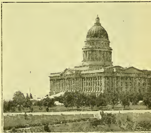
Utah's Staatsgebouw Het prachtige marmereen bouwwerk.

Wat er in het verleden ook tegen deze menschen moge gezegd zijn of heden nog tegen hen wordt gesproken, ik kan slechts zeggen, dat ik hen vriendelijke, beleefde, gezonde, schoone, ontwikkelde, welvarende en gelukkige menschen vond. De leden der Kerk geven een tiende van hun inkomen aan de Kerk. Armoede bestaat er niet. Ofschoon de stipte Mormonen niet rooken, geen alcohol, thee of koffie drinken, gelooven zij in het zich bemoeien met eigen zaken.