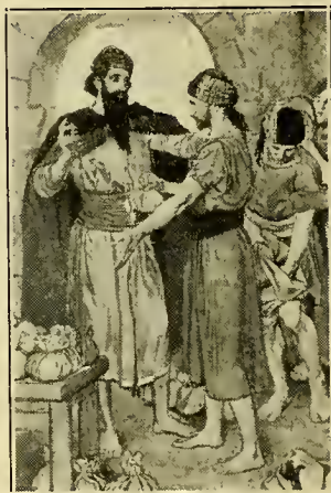
De gelijkenis van de talenten

zaligheid niet een einddoel, doch een proces is; dat de profeet Joseph Smith leerde, dat „wij niet spoediger zalig worden dan wij kennis verwerven.” Ik vestigde de aandacht op het feit, dat wij ons lichaam ontvingen, omdat wij getrouw waren in het leven, voordat wij naar deze aarde kwamen; dat zij, die niet getrouw waren, dit voorrecht verbeurden en wij kennen hen als satan en zijn engelen. Ik haalde het zesde vers van Judas aan: „En de engelen, die hun beginsel niet bewaard hebben, maar hunne eigene woonstede verlaten hebben, heeft Hij tot