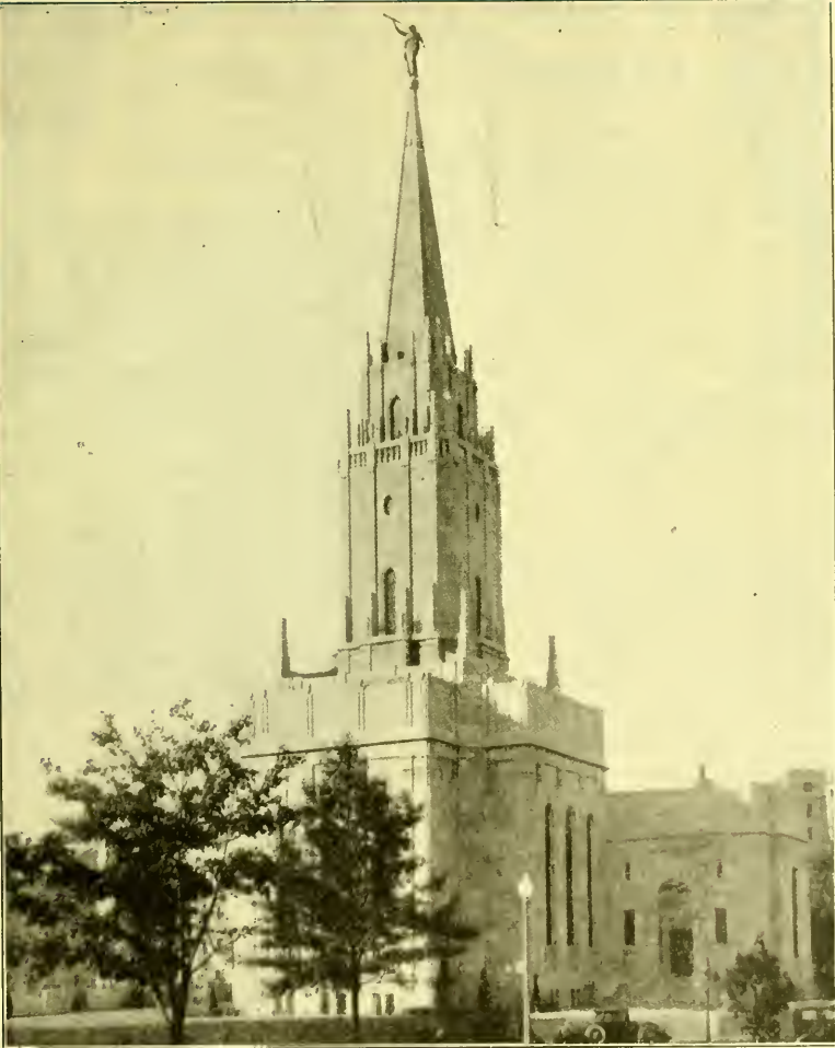
Het Kerkgebouw te Washington D.C.