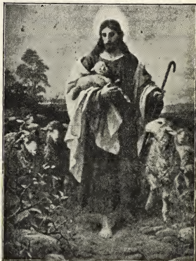
De Heer is mijn Herder

Het Goddelijk-Zijn, ons leven en onze gedachten in toenemende mate beheerschend zal elke plaats en omstandigheid hervormen naar Zijne heerlijkheid, het zal elke menselijke omstandigheid maken