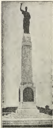
Beeld van den Engel Moroni.

verstrooiden van het Huis Israëls zouden worden vergaderd en dat gouden tijdperk zou worden ingeluid, waarnaar profeten en zieners hadden uitgezien: het Duizendjarig Rijk, wanneer vrede en recht hun scepter zullen zwaaien over de aarde. Ook het aandeel, dat de Profeet Joseph Smith in