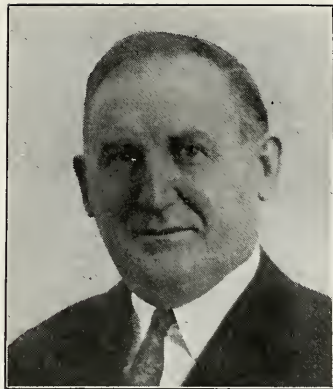
JOSEPH L. PETERSEN nuværende Missionspræsident samt Udgiver og Redaktor af »Stjernen«.

I 1919 skete der en væsentlig Forandring med »Stjernen«s Ud-