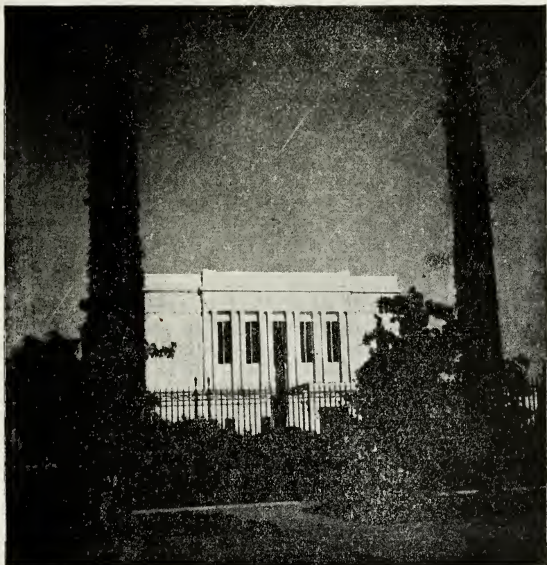
De Sidste Dages Helliges Tempel i Arizona. (Maaneskinsbillede).