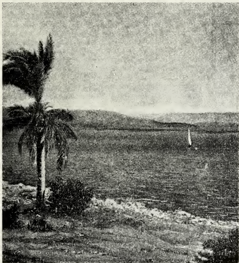
Den Galilæiske Sø.