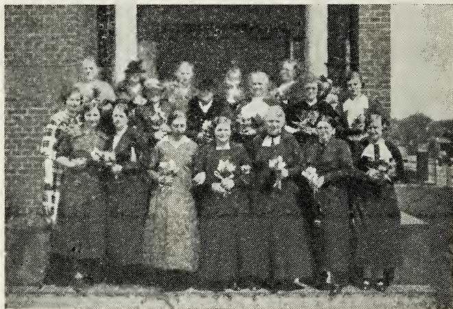
Repræsentanter for Esbjerg Grens kvindelige Hjælpeforening.

Ved et Møde, som blev afholdt kort efter Foreningens Organisation, udtalte Profeten følgende: »Denne Velgørenhedsforening stemmer overens med eders Natur, det er naturligt for Kvinder at have en Følelse af Godgørenhed.