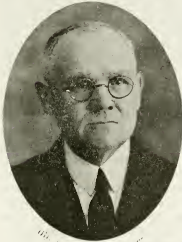
James E. Talmage

At Jesu Aand kom tilbage fra Aandernes Opholdssted og igen iførte sig det Legeme, der var lagt i Graven, fremgaar tydeligt af den hellige Skrift. I den tidlige paa denne Historiens