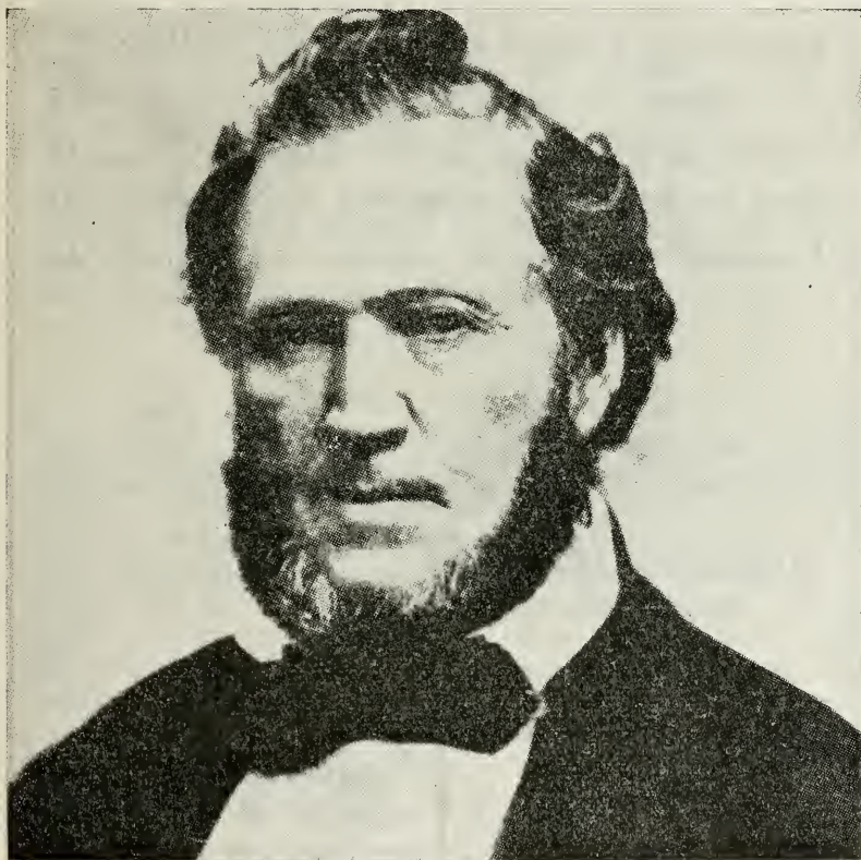
BRIGHAM YOUNG En Kolonisator og Pioner af Guds Naade (Se Artiklen Side 35)