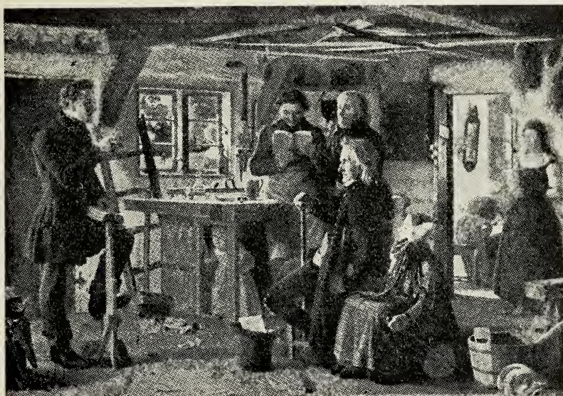
Christen Dalsgaard: To Mormonere er paa deres Vandring komne ind i et Tømmerhus paa Landet, hvor de ved Prædiken og ved Fremvisning af nogle af deres Skrifter søger at vinde nye Tilhængere. 1856. Statens Museum for Kunst, 79 × 111 cm. (Se Artiklerne i Nr. 6 og 7, Siderne 98 og 114).