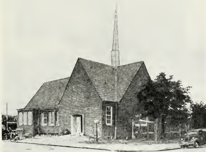
Randers kirkebygning fotograferet i slutningen af august måned 1953.

Randers: Arbejdet med kirkebygningen i Randers er nu skredet stærkt frem, og vi bringer hermed et billede, der viser kirkebygningen, som den tog sig ud i slutningen af august måned.