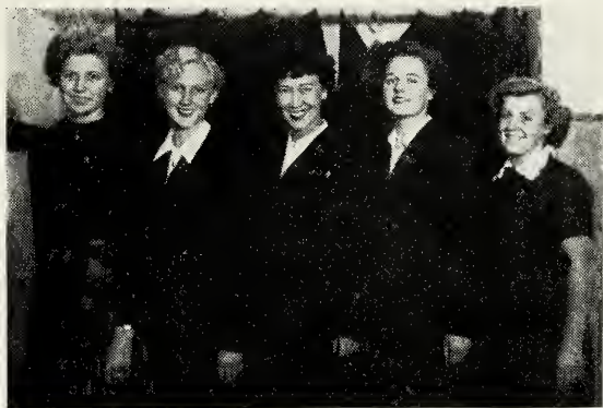
MIA MAIDS i Odense opnår ærestitlen MIA JOY

Bemærk: Oplysningerne om dåb, velsignelser, ordinationer, emigrationer, udelukkelser og dødsfald er taget fra de officielle attester, som missionskontoret modtager fra grenene, og meddelelser om eventuelle fejl eller manglende data bedes derfor rettet til den pågældende grensforstander.