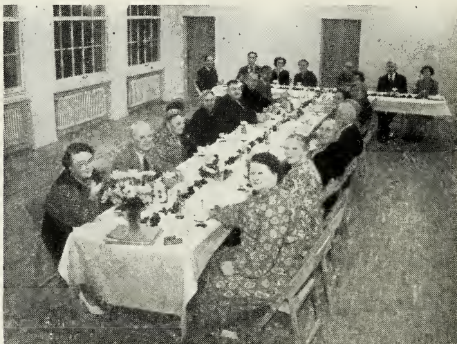
Fest for de ældre i Odense.

Odense: Lørdag den 5. september havde Odense gren arrangeret en fest for medlemmer over 50 år. Man mødtes om eftermiddagen i kirken i St. Graabrødrestræde og gik derfra til en af byens biografer, hvor den forfilm, der beretter om vor kirke, blev vist. Efter biografuren gik man til den nye kirkebygning i Lahns-gade, og dér havde