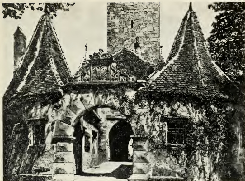
Byport i Rothenburg.

for det ville hurtigt være forbi. Farver, blomsterduft, mosgroede mure med roser, snævre gader, blomsterkasser ved alle vinduer, smukke, gamle brønde, der stadig er samlingsstedet for byens indbyggere (men hvis vand det absolut frarådes at drikke!!), alt dette skal opleves . Vi kom dertil ad den vej, der kaldes for »den romantiske«, og det med rette. Vi står højt oppe ved en af byportene og ser ud over et stor-slået landskab. Det bliver så stille i en ved synet af al den skønhed. Byporten, vi skulle igennem, var så smal, at det var med nød og næppe, vi kom igennem.