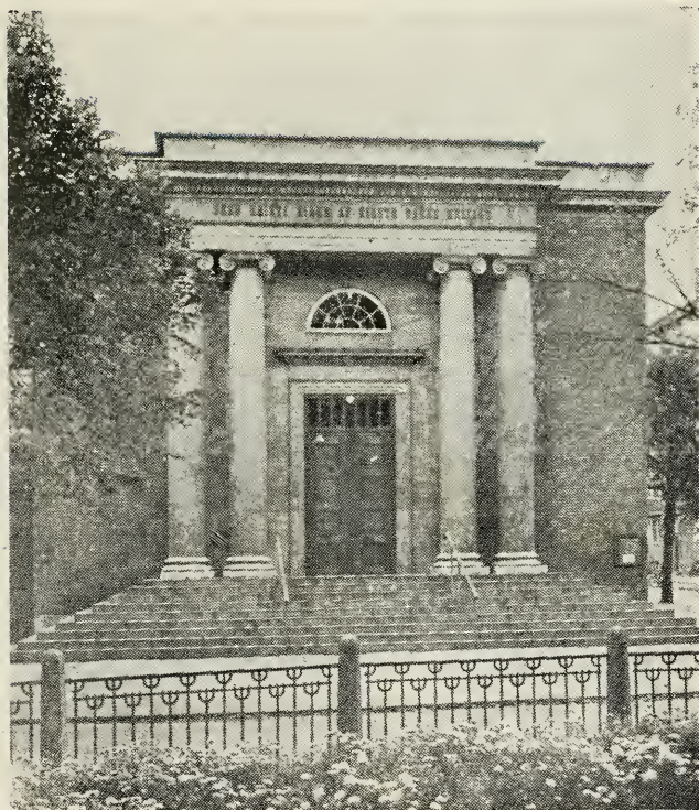
København grens kirkebygning. Indviet 14. juni 1931.