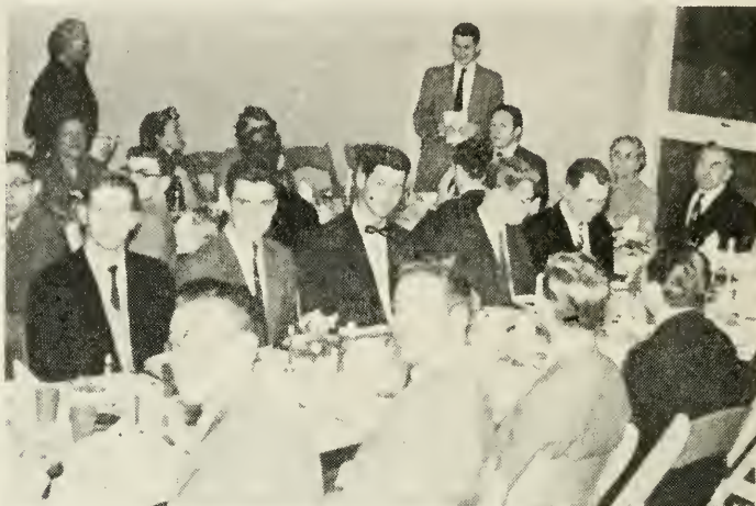
Fra Thanksgiving Day.

Thanksgiving Day, som er den sidste torsdag i november, fejres hvert år som en af de største helligdage af alle amerikanere over hele verden. Også missionærerne i den danske mission fejrede dagen, og vi bringer hermed et par billeder fra den fest, som missionærerne i