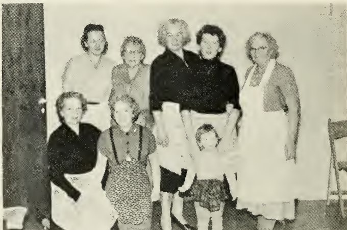
Fra Thanksgiving Day.

København og Amager gren holdt i den nye kirkebygning på Amager. Det ene billede viser missionærerne ved det festligt smykkede bord, hvor de fik serveret kyllinger med mange slags grønsager samt ægte amerikansk pie. Det andet billede viser søstre fra Kvindelig hjælpeforening i Amager gren, som havde tilberedt og serverede maden.