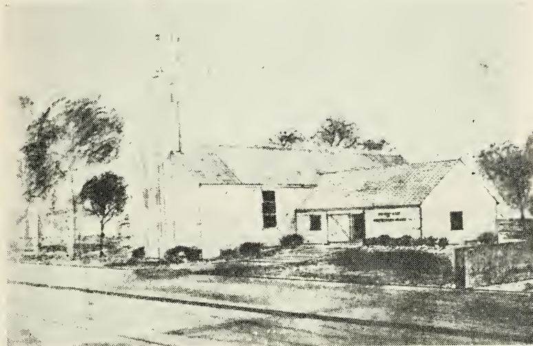
Tegning af den nye kirkebygning i Aarhus.

Søndag den 27. november 1955 var en betydningsfuld dag i Aarhus grens historie, for den dag indviedes byggegrunden til den nye kirkebygning, der vil blive rejst i Langenæs Allé.