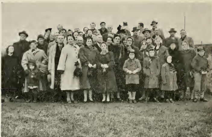
Fra indvielsen af byggegrunden i Aarhus.

vi ældre, tænker på at forlade den gamle kirke, hvor vi har haft så mange gode stunder. Men udviklingen lader sig ikke standse, og jeg håber, at bygningen af den nye kirke må være signal til en stor fremgang for Aarhus gren. Til slut bad han Gud velsigne arbejdet.