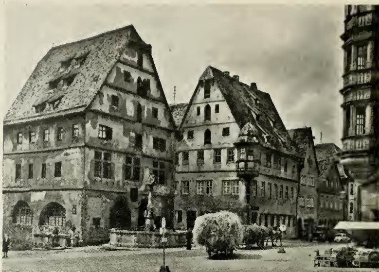
Parti fra Rothenburg.

Måske skulle vi lige bemærke, at hotellet var dejligt , hvad de forøvrigt var alle steder, med en enkelt undtagelse, hvor både dyner og senge var for korte. Ellers var det modsatte tilfældet: vi lå i kæmpestore senge med do. dyner! Den varme mad og morgenmaden var også upåklagelig, men frokostpakken, nå ja..... de forvante danskere!