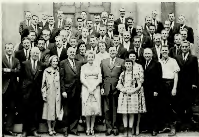
Præsident Dyer og søster Dyer i København med missionærerne fra Københavns 4 missionærdistrikter. I første række ses desuden Kirkens revisor Schmidt samt biskop og søster Buehner

Tidlig søndag morgen blev der afholdt et møde, hvor præsident Dyer gav de sidste instruktioner og råd. Mødet blev holdt med alle de omrejsende og præsiderende ældster fra hele Danmark. Under præsidentens ophold i Danmark blev systemet med de omrejsende ældster fuldstændigt revideret, og adskillige nye omrejsende ældster blev valgt. Kl. 10,30 afholdtes formiddagens konferencemøde, hvor sidste taler var præsident Dyer. Der var omtrent 290 tilstede. I løbet af eftermiddagen inspicerede præsident Dyer og præsident Thorup eventuelle fremtidige byggegrunde, og et møde for præstedømmets ledelser blev afholdt. Aftenmødet begyndte kl. 17, og der var omkring 350 tilstede eller omtrent 40 % af det samlede medlemsantal i Køben-