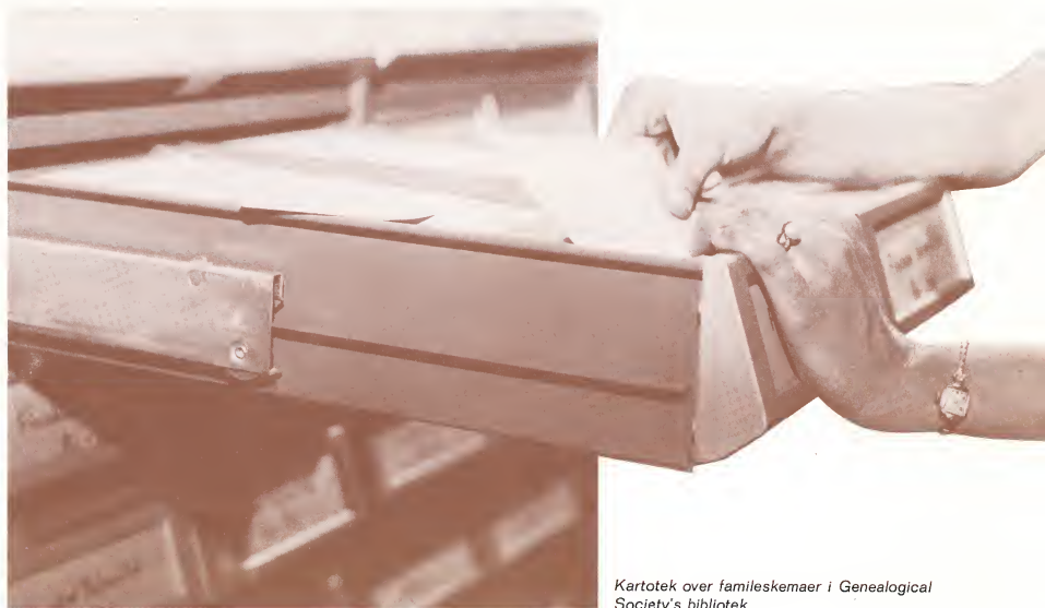
Kartotek over familieskemaer i Genealogical Society's bibliotek