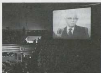
Le président Kimball tel qu'on le voit dans le Tabernacle par satellite au cours des sessions du dimanche

«Les rebelles seront transpercés de grandes afflictions, car leurs iniquités seront proclamées du haut des toits, et leurs actions secrètes seront révélées.