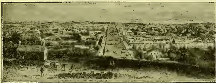
Salt Lake City, zooals het er in 1865 uitzag

Bij een dezer gelegenheden riep president Young bisschop Edward Hunter, die presideerend bisschop der Kerk was, naar voren en vroeg hem, verslag over zijn arbeid uit te brengen. De goedaardige bisschop gaf o.a. ook een biografische schets van zijn leven. Hij vertelde, dat hij in Chester County, Pennsylvania was geboren en grootgebracht. Daarna werd bisschop Woolley geroepen en hij vertelde ook, dat hij in Chester County, Pennsylvania geboren was. Na bisschop Woolley bracht bisschop Weiler verslag uit en zeide, dat het hem ook aangenaam was te kunnen