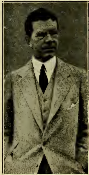
Z.K.H. Kroonprins Gustaaf Adolph van Zweden.

Wij zaten bij een raam, dat uitzicht gaf op het Gustaaf Adolph-plein. Aan de linkerzijde ligt het Rijksdag Gebouw, in het midden het Gustaaf Adolph-monument, aan de rechterzijde de Royal Opera en verderop