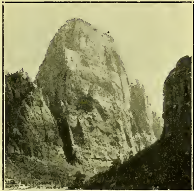
De Groote Witte Troon

Wij overnachtten in de gebouwen, in de verschillende „canyons” gelegen. Dit zijn hotels, door de Union Pacific Railroad geëxploiteerd. Het seizoen is kort en deze hotels hebben een groot aantal jonge mannen en vrouwen ter beschikking, college-studenten, die allen op deze wijze hun vacanties doorbrengen en geld verdienen om weer