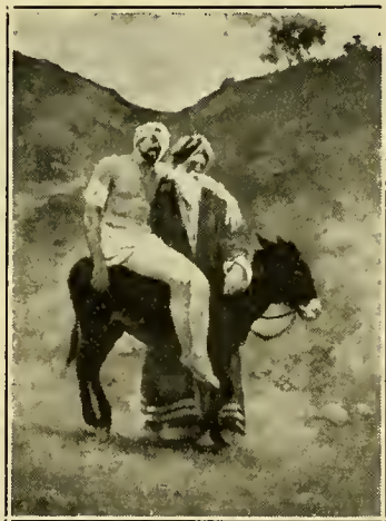
De Barmhartige Samaritaan

En het evangelie van liefde treft doel. Ik heb het meermalen toegepast gezien. Ik heb het in strijd gezien met de beginselen van hebzucht