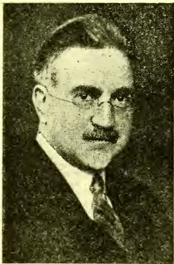
„Vreugde is niet zelfzuchtig”

Er is een gezegde onder de Heiligen der laatste dagen, thans over de geheele wereld bekend en gesproken door een Boek van Mormon -profeet van ouds, een Nephtien -profeet, die enkele honderden jaren voor de geboorte van Jezus Christus leefde, dat „de menschen zijn, opdat zij vreugde mogen hebben”. Indien dit juist is — en wij aanvaarden deze leerstelling in de Kerk — dan is het 't belang der Kerk, welke voor het welzijn der menschen werd opgericht, zooveel als in haar ver-