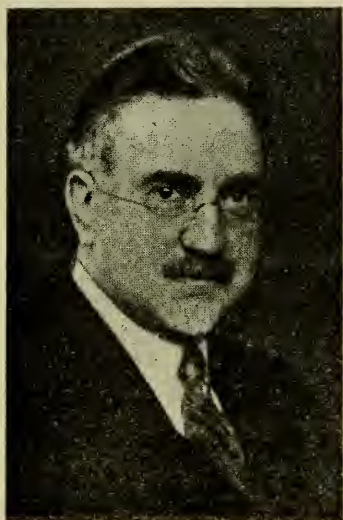
Dr. John A. Widtsoe.

Deze vraag doet in belangrijkheid alleen onder voor die betreffende het wezen van God.