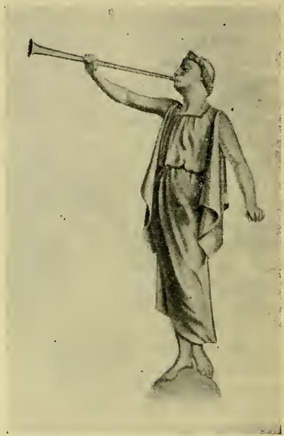
De Engel Moroni, die Joseph Smith de gouden platen ter hand heeft gesteld.

hij zich dan niet van de kortere uitdrukking? De reden is afdoende. In den tijd n.l., dat Lehi Jeruzalem verliet, werd de taal van zijn volk nog niet met den naam „Hebreeuwsch” aangeduid.