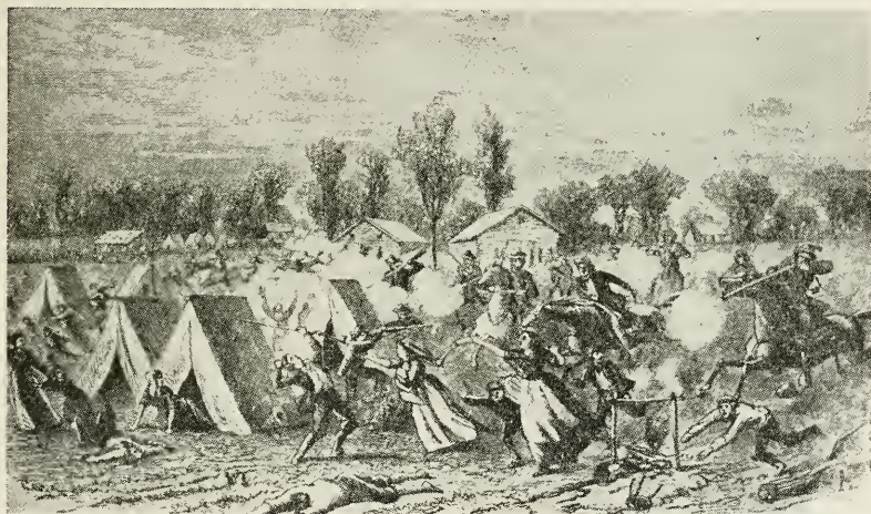
Massakren paa Mormonerne ved Haughn's Mill (efter et samtidigt Stik).