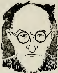
Heber J. Grant.