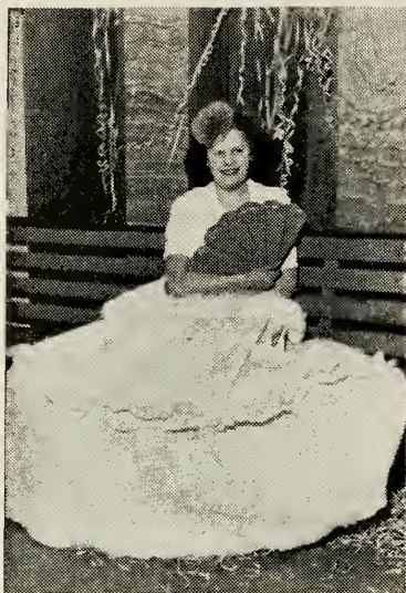
Kjole helt af Crepe.