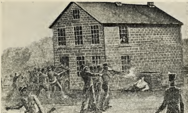
Joseph Smiths Død (efter et samtidigt Stik).