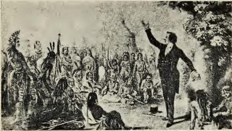
Joseph Smith taler til Indianere

„Og dette Riges Evangelium skal prædikkes i hele Verden til et Vidnesbyrd for alle Folkeslagene. (Matth. 24. 14.)