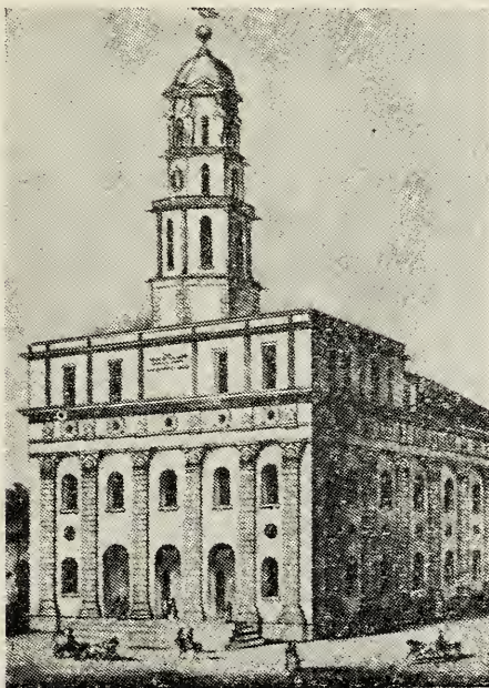
Templet i Nauvoo.

Joseph smilede. En Mand, som var sluppet ud af Lænker og Fangekældre, skulde ikke være bange for en Sump. Desuden kunde han