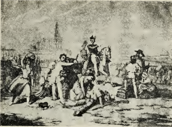
Joseph Smith betragter Ødelæggelserne efter et Overfald paa Mormonerne i Nauvoo.

„Salige er de, som er forfulgte for Retfærdigheds Skyld -“ (Matth. 5.10.)