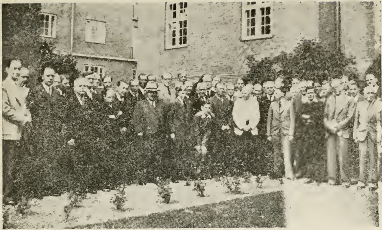
Det danske Præstedømme

var i højeste Grad opløftende at høre disse Brøders stærke Vidnesbyrd, en Oplevelse, der sikkert langt frem i Tiden vil styrke Præstedømmets Myndighed og Sammenhold.