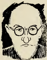
Heber J. Grant.

Endnu et af Kirkens Virksomhedsaar med Tilvækst og Fremgang blev afsluttet den 31. December 1943. I mange Henseender var det et usædvanligt Aar, et Aar, hvor man maatte tilpasse sig forøgede Krigstidsrestriktioner, et Aar med Forandringer og et Aar med fornyet Paamindelse om hvor vigtigt det er at leve efter Jesu Kristi Evangelium.