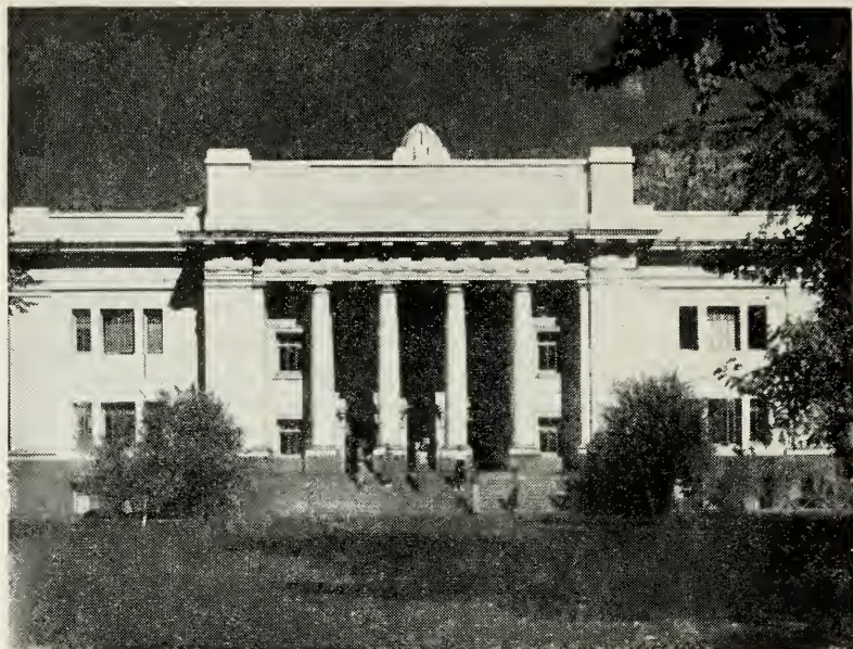
Brigham Young Universitetet i Provo, Utah. Bygningen til minde om Karl G. Maeser.

minarier*) og religions-skoler, egnet for højskoler og universiteter. Her gives der eleverne undervisning i Det gamle og nye Testamente så vel som i Kirkens historie og lære. Der drives nu 102 seminarier i forbindelse med højskoler i Utah og ømbliggende stater og 14 religions-skoler beliggende i nærheden af vestlige universiteter.