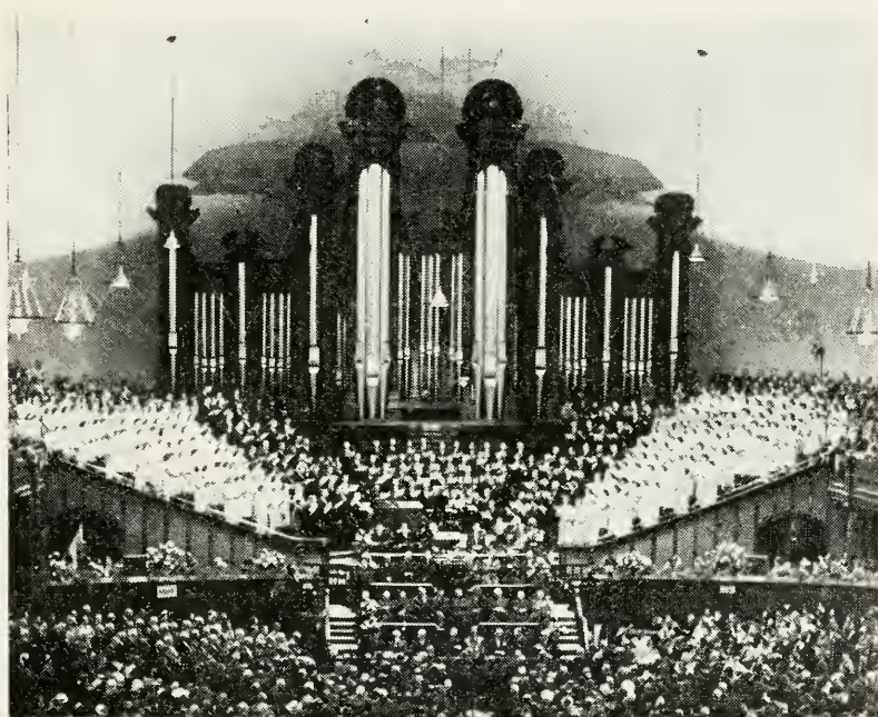
Koret og orglet i Tabernaklet, Salt Lake City, Utah.