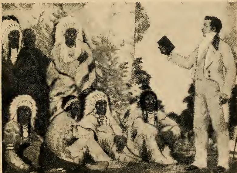
Joseph Smith fortæller en gruppe indianere historien om deres forfædre, således som den står skrevet i Mormons bog.