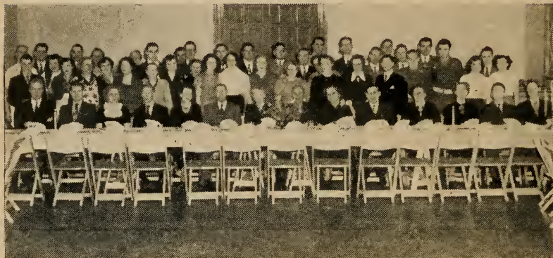
Billede taget under banketten i København gren.