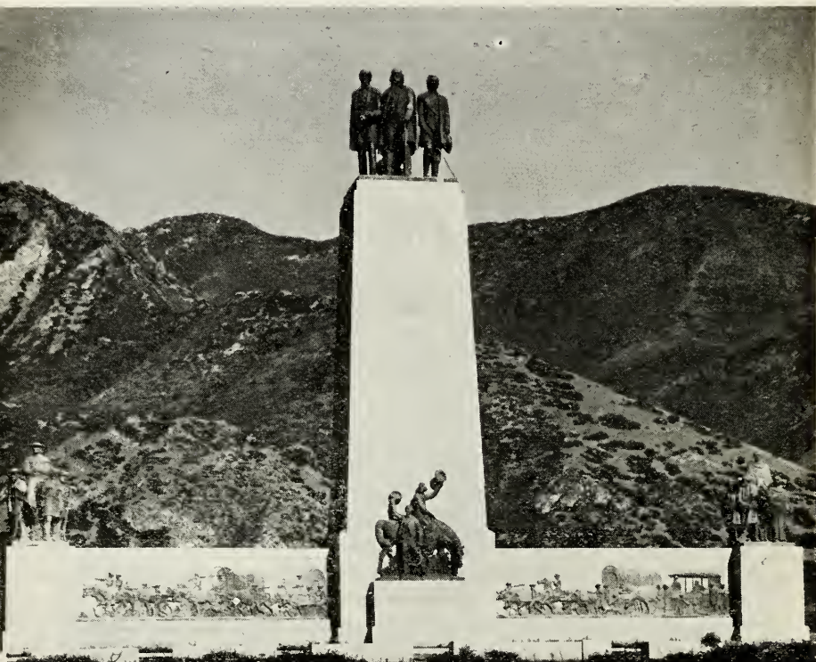
Monumentet „Dette er stedet“.

Den 21. juli kom Orson Pratt og Erastus Snow, to fremrykkede spejdere, ind i Saltsødalene. Tre dage senere red Brigham Young, som havde bevæget sig langsommere på grund af sygdom, ud af bjergkløften og så ud over dalen. Han gjorde en pause, og med profetisk gestus sagde han: „Dette er stedet.“