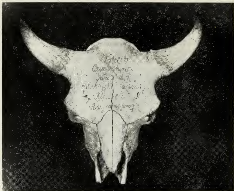
Bulletin fra sletterne.

ud af, at vi befandt os på breddegrad 41^{\circ} 30' 3'' . Med vore kikkerter kan vi nu se Chimney Rock i en afstand af 42 miles oppe ad floden. På denne afstand ligner det et lavt tårn, der er sat ovenpå en bakketop. Endnu 4\frac{1}{4} miles førte os til et andet sted, hvor floden slår ind mod klippevæggene; som sædvanlig var vi nødt til at passere over den, og i løbet af ca. 2\frac{1}{4} miles kom vi igen til prærien, og efter at vi havde kørt et kort stykke, slog vi lejr; vi havde da tilbagelagt 15\frac{1}{2} miles den dag. Gennem mange miles har formationen, især klippernes, skiftet lidt efter lidt fra