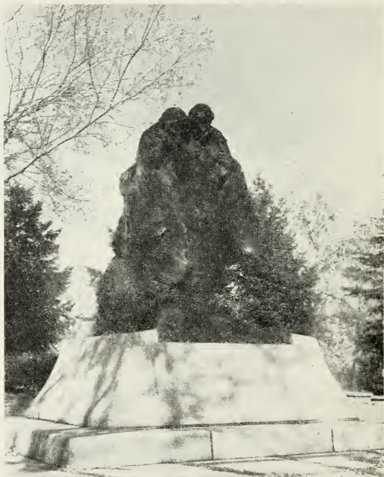
Monumentet „Tragedien i Winter Quarters“.

Det lille samfund havde også sine fornøjelser, selv om behagelighederne var få. Der blev ofte danset under ledelse af de