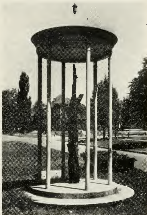
Det enlige træ, som stod i dalen i 1847.

To timer efter, at hovedstyrken af pionererne var ankommet, blev den første pløjning i Saltsø-dalen foretaget. Men jorden var så tør og hård, at plovne gik i stykker. Så blev en af bjergstrømmene afledet, jorden blev vandet, og derefter blev det