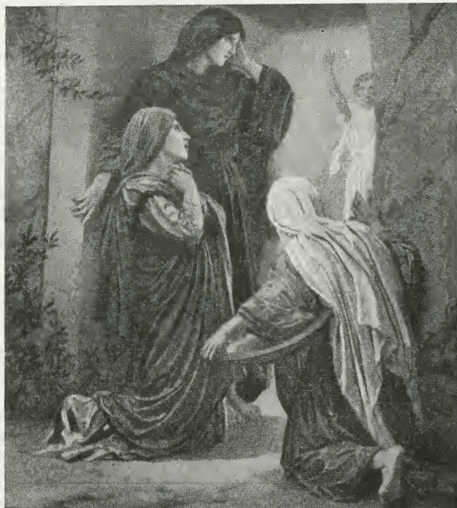
»Han er ikke her – Han er opstanden«