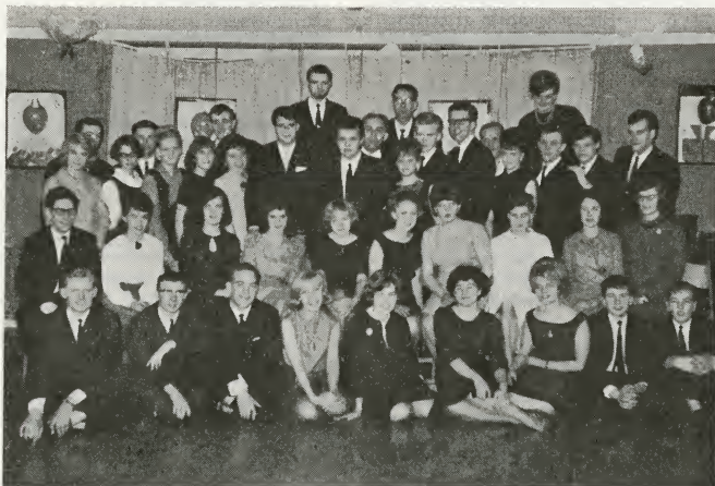
Deltagerne i festen lørdag aften.