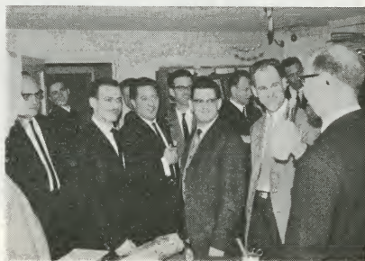
Besøg i missionens trykkeri, Dalgas Boulevard 164